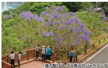
「道の駅」なんごう周辺のジャカランダ

世界三大花木の1つ「ジャカランダ」が日本で唯一、1,000本近くご覧になれるのは、南郷のみ!目の前に広がる太平洋の青とジャカランダの紫のコントラストは絶景です。外浦港では地場産品販売のふれあい市も開催。