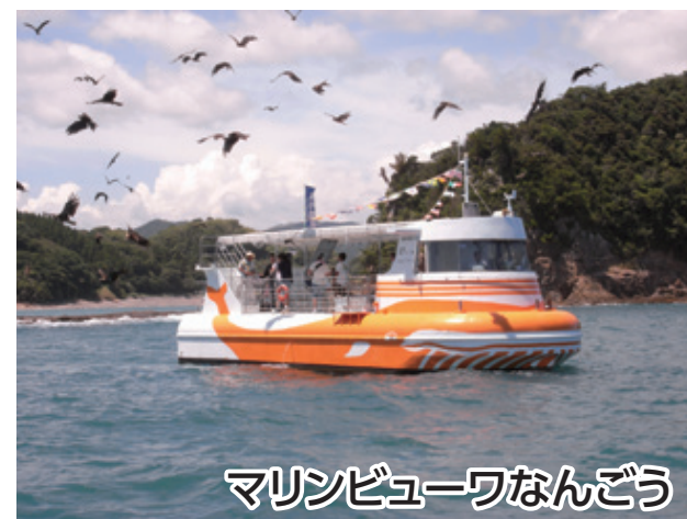
マリンビューワーなんごう