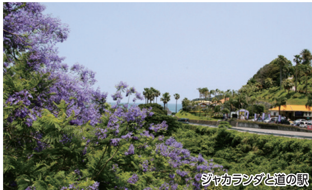
ジャカランダと道の駅

世界三大花木の1つである「ジャカランダ」に囲まれ、潮風を感じながら、太平洋が広がる日南海岸をお楽しみいただけます。