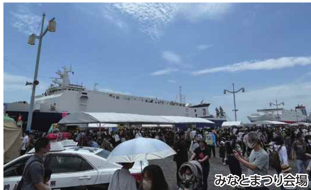
みなとまつり会場

海風を感じる広大な大淀川河川敷と後田川緑道のせせらぎ水路を進み、宮崎港へ!宮崎みなとまつり会場では、ステージイベントの他、船内見学やお仕事体験など、楽しい企画がいっぱいの海と川よくばりウォークです。