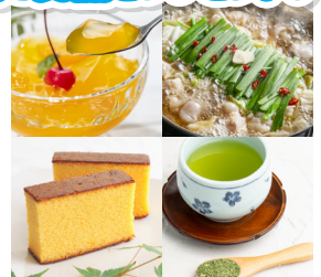
※ 画像はイメージです。

※当選者の発表は、賞品の発送をもって変えさせていただきます。 ※歩いた歩数を「SALKO」に反映させるためできるだけアプリを1日1回起動してください。 (最低2～3日に1回は起動させる必要があります。)