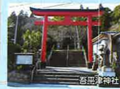
Myohira Tsu Shrine, Horiegawa Library