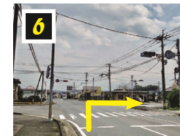
▲穂北交差点を右折