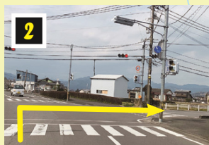
▲信号を右斜め方向へ右折