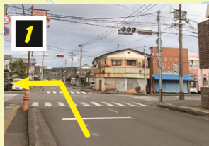
▲西都市白馬町交差点を左折