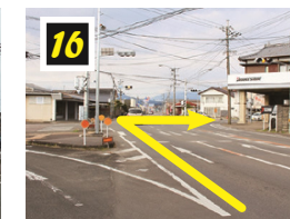
▲三笠交差点を右折