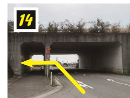
▲トンネルを抜けて一時停止を左折