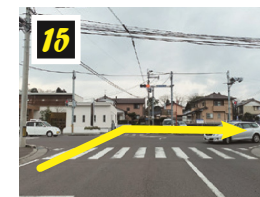
▲妻南小学校過ぎの交差点を右折