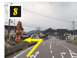
▲左手に塙輪がある交差点を左折