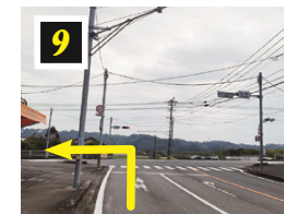
▲岩崎交差点を左折