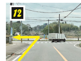
▲T字路の交差点を左折