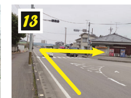
▲馬継谷交差点を右折