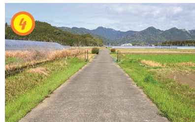
▲山々や田畑を眺めながら漕ぎ進める