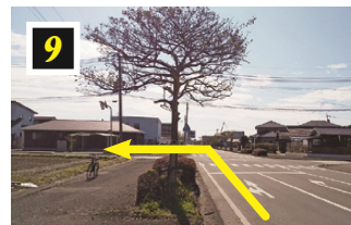
◀右手に都萬神社が見える交差点を左折