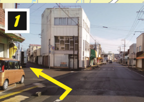
▲橋を渡って斜め方向へ左折