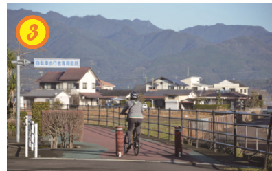
▲この区間のサイクリングロードは特にオススメ