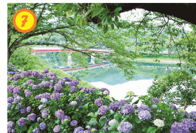
▲杉安峡のアジサイ