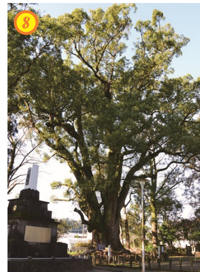
▲南方神社内にあるクスノキ。推定樹齢1000年、国指定天然記念物「上穂北のクス」