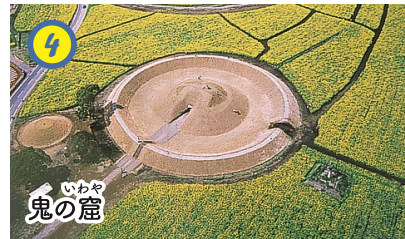
▲西都原古墳群で唯一横穴式石室を有する古墳。コノハナサクヤヒメを嫁にと請う鬼が、父オオヤマツミミコトの要求により一夜で完成させた窟と伝えられています。