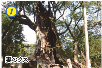
妻のクス ▲2度の火災に遭いながらも力強く生きているクスノキ。