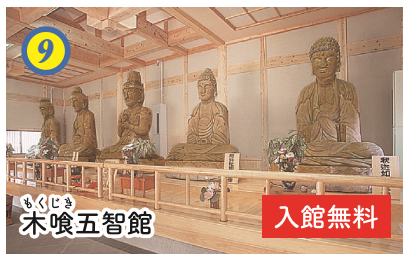
木喰五智館 入館無料